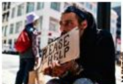
Sur les trottoirs de San Francisco, à deux pas des locaux de Twitter, d'Airbnb ou d'Uber, les SDP sont de plus en plus nombreux.

ENQUÊTE L'affolante montée des prix exclut une partie croissante de la population.