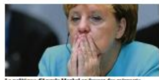
La politique d'Angela Merkel en faveur des migrants lui coûte cher dans les urnes.